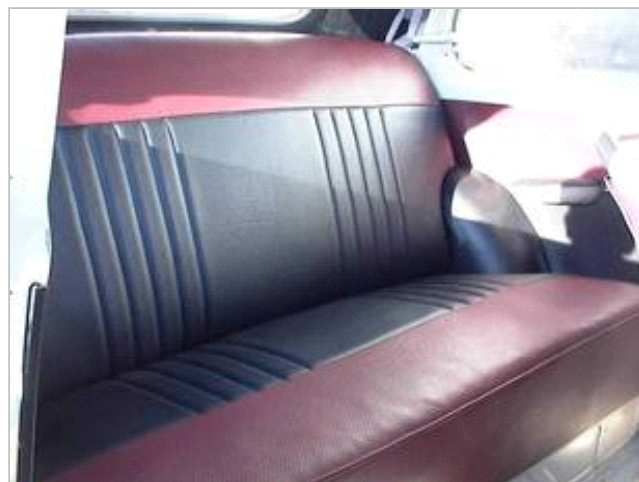
Bagsæde i en Opel Olympia '54 cabriolet